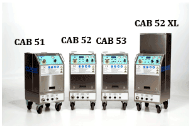
CAB mašine za peskiranje